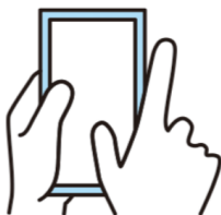
コンプライアンス研修